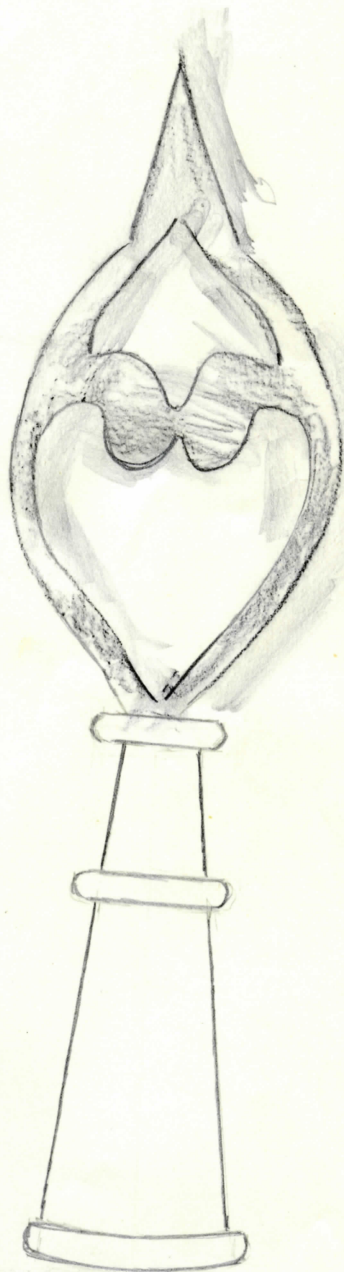
spets i nat.storlek